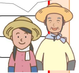
＜飼料用米、米粉用米の交付単価のイメージ＞