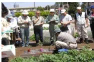
体験農園開設に向けた講師による指導