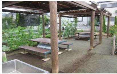
休憩所・手洗い場等附帯施設