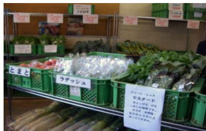
農産物販売強化促進施設