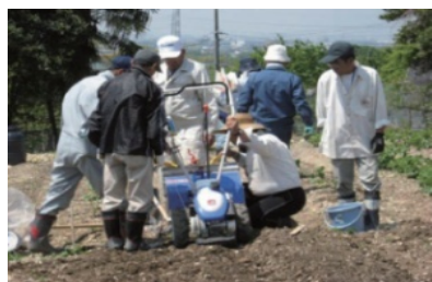
新技術導入のための実験活動(講師謝金等)

「農」のある暮らしづくりに向けた地域活動や付随する簡易な施設整備を国が400万円まで助成します。