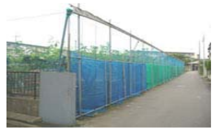
農薬飛散防止施設 (防薬ネット)