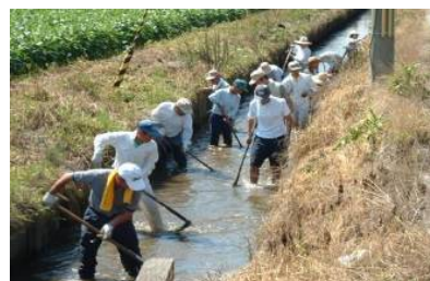
農業者と都市住民による農業用水路の清掃活動