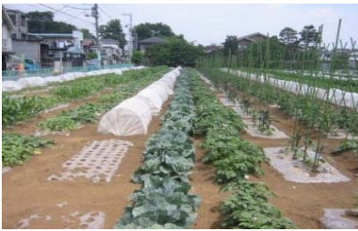
市民農園・福祉農園