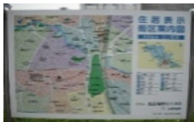
防災マップの作成