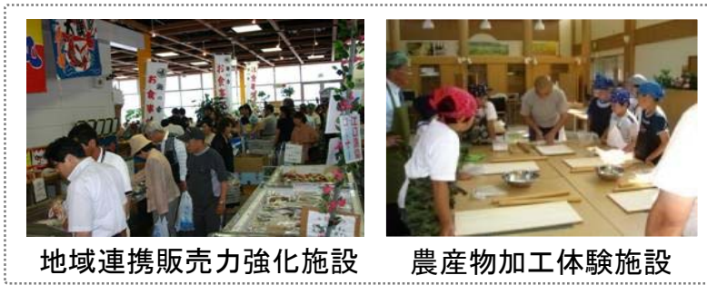
地域連携販売力強化施設