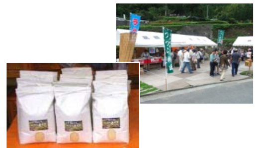
地域製品のブランド化