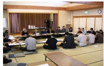
新たな取組の計画づくり