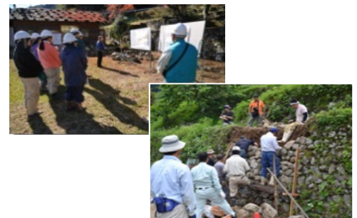
住民参加による農業資源の整備