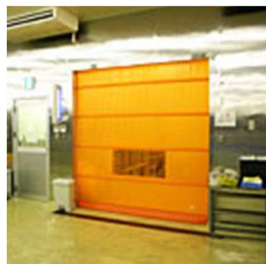
D.ゾーンシャッター