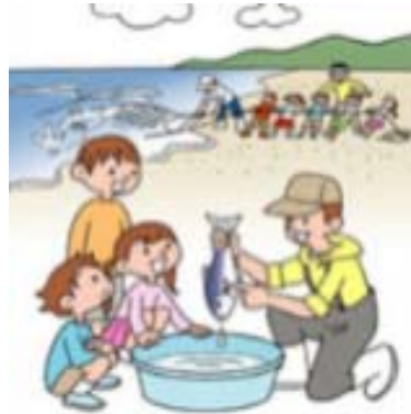
教育と啓発の場の提供