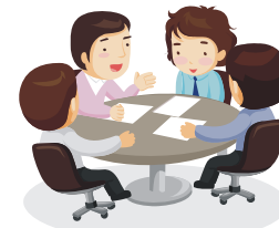
花粉症対策品種等のコンテナ苗の生産や利用の拡大に取り組む協議会への支援