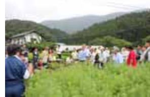
生産技術習得・向上の取組への支援