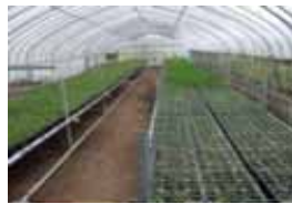
種苗生産施設等の整備に対する支援