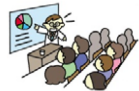
森林所有者の花粉発生源対策への普及啓発 花粉症対策品種の生育環境への適応性の評価 花粉飛散量推定のための調査