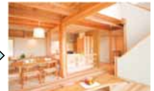
分別管理・流通等のための取組を支援 地域の工務店等によるモデル的な木材利用拡大を支援等