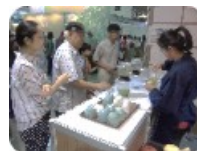
<マーケティング調査>