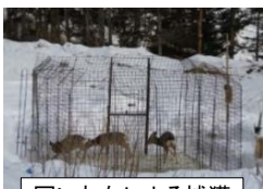
囲いわなによる捕獲

シカによる森林被害が深刻な地域等において、地域の連携による捕獲やジビエへの有効活用のための効率的な情報提供等をモデル的に実施。