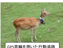
GPS首輪を用いた行動追跡