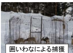
囲いわなによる捕獲