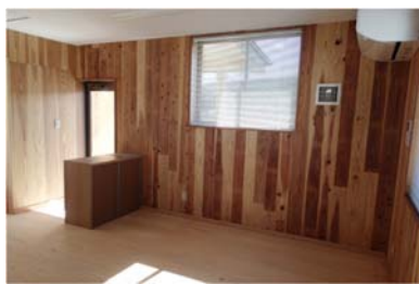
内装木質化 (磐城森林管理署草野森林事務所)