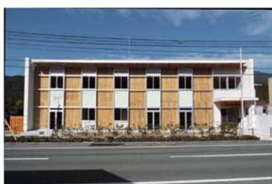
木造新築庁舎 (嶺北森林管理署)