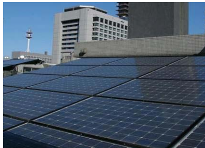
屋上を利用した太陽光発電