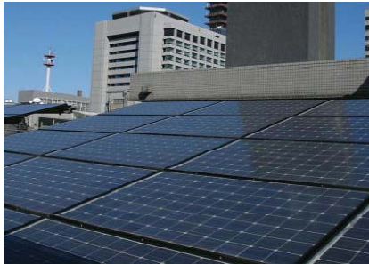
屋上を利用した太陽光発電

農林水産省の屋上には太陽光発電設備を設置しており、当該設備で発電した電気を省内の食堂から発生した生ゴミを堆肥化する機械で使用しています。