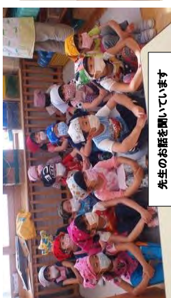
先生のお話を聞いています