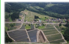
中山間の総合の整備