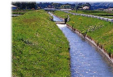
農業用排水施設の整備