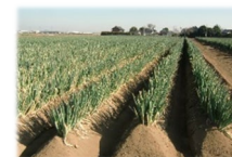
汎用田でのネギ栽培