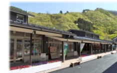
販売促進施設の整備