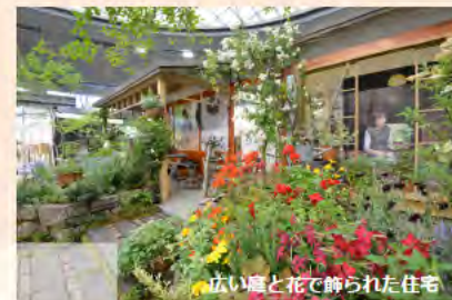
広い庭と花で飾られた住宅