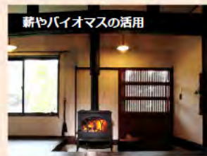
薪やバイオマスの活用