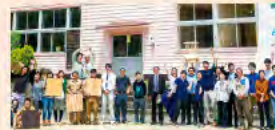
地方で起業するローカルベンチャー