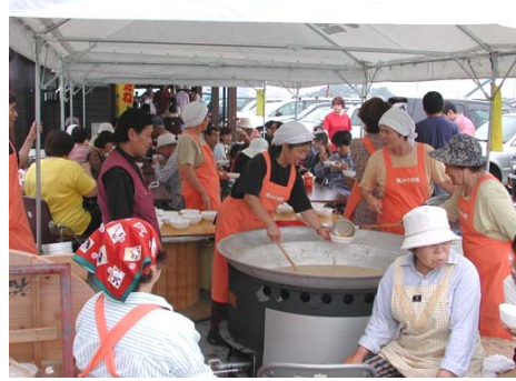
写真3 交流イベントの様子

一方、「福ふくの里」では、開設当初から毎月千人鍋（豚汁、海鮮汁）や七草粥などを無料でふるまい、隣接した「ふれあい交流農園」では消費者との体験交流イベントを開催している。また、「福ふくの里」前の水田では秋はコスモス園、春は菜の花園に姿を変え、今では地域観光コースになっている。