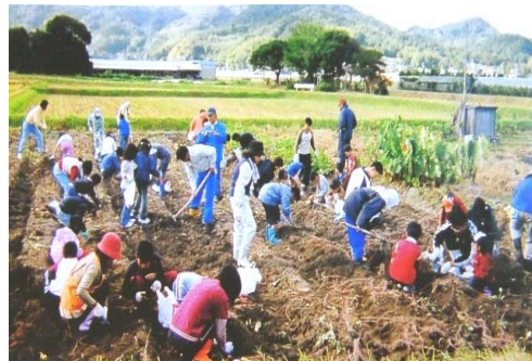
写真4 食育活動の取組

子供達に対する食育をより一層促進するため、農業者が小学生に水稻、ブロッコリー、サツマイモ等の栽培を指導している。また、JAカンキツ部会福吉班では、学校給食へカンキツを10月から4月まで毎月2回無料で提供している。