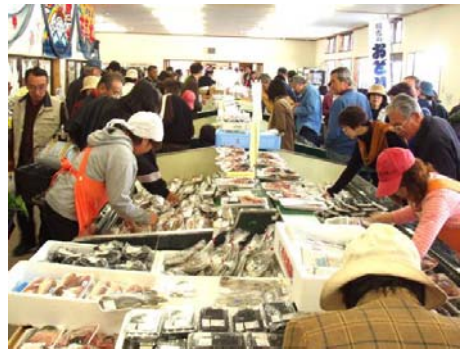
写真2 水産物販売の様子

平成17年は漁家の90%にあたる45名が出荷しており、販売額は年々着実に増加し、2.4億円に達する等、重要な販売ルートの一つとして確立し、漁業の活性化に大きな効果をもたらしている。