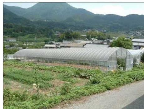
写真 1 ハウスリース制度で建設されたハウス

生産拡大のためには「出荷者の土地に直売所がハウスを建てればよいのではないかと考え、生産者育成のための独自のハウスリース制度を平成 16 年に創設した。これは希望者が建設費の 70% を 5 年間、リース料として支払えば、その後は自分の施設となる仕組