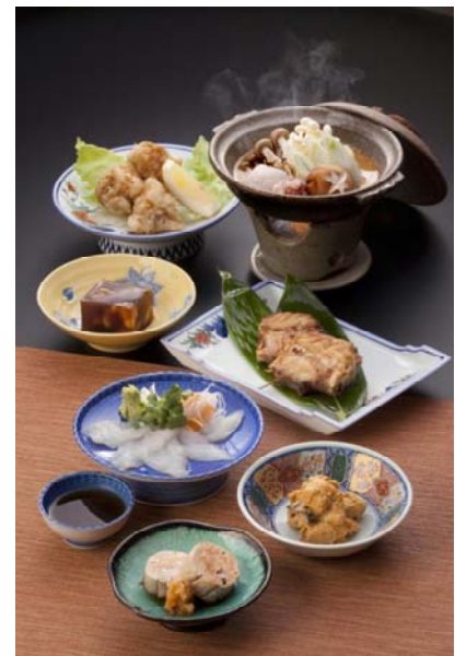
写真5 「風間浦鮫鱈 フルコース料理」

このことから、漁業が基幹産業である風間浦村において、ブランド戦略会議が取り組む共同活動は、漁協を中心とした漁家経営を一層安定させるだけでなく、風間浦村の商工・観光業者や試験研究機関、行政など広範囲な人々を結集してブランド化に向けた取組を進め、販路開拓と冬場の観光振興により、貴重な「外貨」の獲得につながっている。