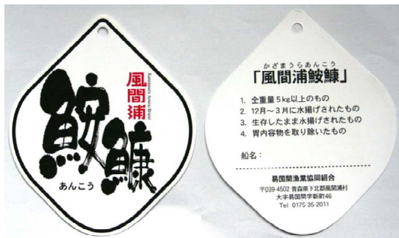
写真2 「風間浦鮫鱈」ブランドタグ

平成26年9月には、村内3漁協の連名により申請された「風間浦鮫鱈」が地域団体商標として登録されたことを機に、平成27年に「ゆかい村風間浦鮫鱈ブランド戦略会議（以下「ブランド戦略会議」という。）」へ名称を変更した。