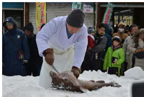
写真1 鮫鯨の「雪中切り」

このような中で、平成22年12月に東北新幹線全線開業を控えた平成21年に、漁業者、旅館組合、研究機関、県等を交えた地域の活性化等に関する懇談会が開催された。ここで観光資源として着目されたのは、村内3漁協が資源管理に取り組み始めていた国内トップクラスの水揚げを誇るキアンコウであった。全国的には沖合底びき網により水揚げされるが、風間浦村のキアンコウは、身近な漁場において魚体への負担が少ない「空縄釣り」と呼ばれる伝統漁法や「固定式刺し網」により漁獲されているため、ほとんどのキアンコウが生きたまま水揚げされる。また、地元では、古くからキアンコウを雪の上で捌く「雪中切り」という独特な捌き方が行われている。