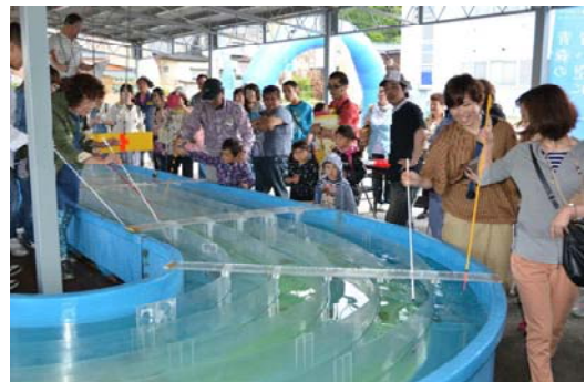
写真4 「元祖 烏賊様レース」

ブランド戦略会議を構成する風間浦村きあんこう資源管理協議会が中心となって、風間浦地域の全漁業関係者が一体となったキアンコウの資源管理が展開されたことで、地域ぐるみの漁業経営が一層安定化するとともに、当該地域の主要な水産物であるキアンコウの持続的な漁業生産にもつながっている。これにより、