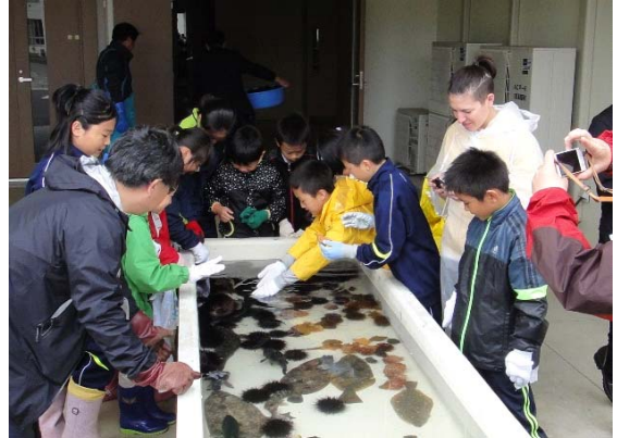
写真6 「小学生を対象にした水産教室」

ブランド戦略会議の構成員である易国間漁協に所属し、県の指導漁業士として認定された漁業者が、毎年、地元の易国間小学校の児童を対象として「水産教室」を開催し、キアンコウなどの地元で漁獲される水産物を題材にして、その生態や漁法等に関する学習を行うなど、将来の漁業の後継者となる子供達へ地域の基幹産業である水産業及び地域の財産ともいえる水産物についての理解をより一層深める取組を行っている。