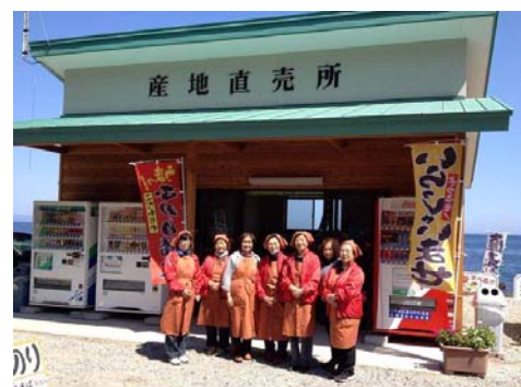
写真3 海藻の産地直売所「ふのりちゃん」

平成25年5月に蛇浦地区に海藻に特化した産地直売所「ふのりちゃん」がオープンし、村内3漁協の女性により運営されている。