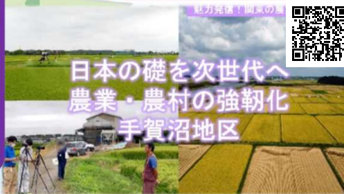
日本の礎を次世代へ 農業・農村の強靱化 手賀沼地区