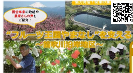
“フルーツ王国やまなし”を支える ～笛吹川沿岸地区～