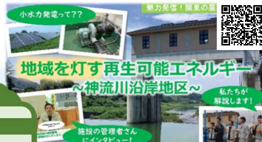
地域を灯す再生可能エネルギー ～神流川沿岸地区～