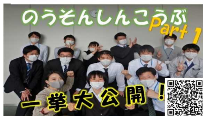
関東農政局で農業農村整備 に携わる魅力5つ!