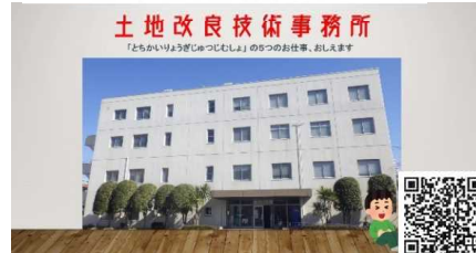
土地改良技術事務所 5つのお仕事教えます