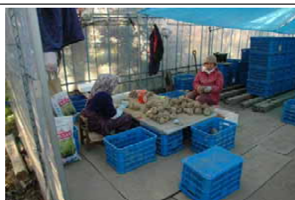
つくね芋の出荷作業