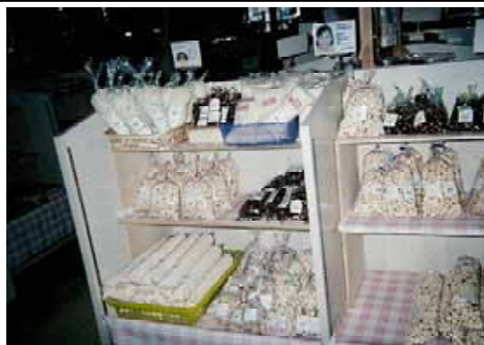
「道の駅」加工品販売コーナー