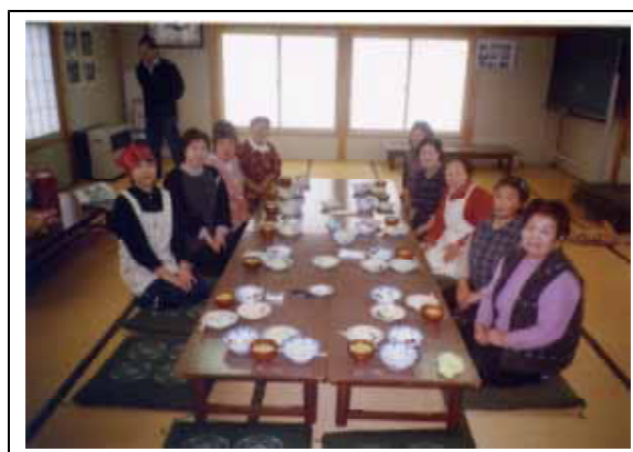
スローフード講習会