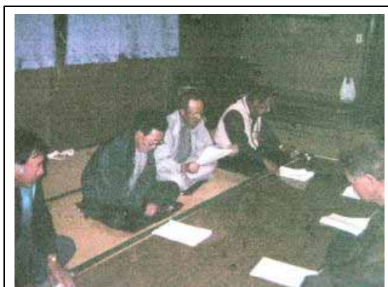
中田沢集落営農集団組合設立総会

また、より効率的・積極的に活動を推進していくため、隣接の上田沢集落協定と将来的に合併を目指すこととしている。