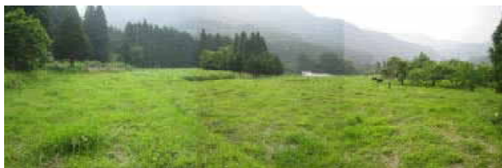
カヤの生育が押さえられた放牧地

20年度は、5月12日から出産間近の妊娠牛2頭を借り受け、試験的に、牧場内で出産させたところ、8月5日午前と6日の夕方に、オスの子牛2頭が無事生まれた。2頭の子牛は、広い牧場内を元気に走り回るなどすくすくと育ち、11月10日、親子の4頭が無事退牧し、本年の放牧を完了した。