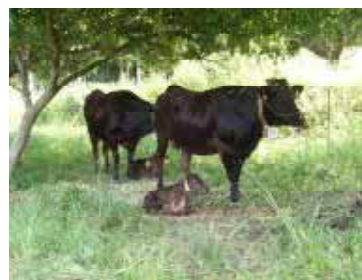
ゆずりお牧場でくつろぐ牛の親子