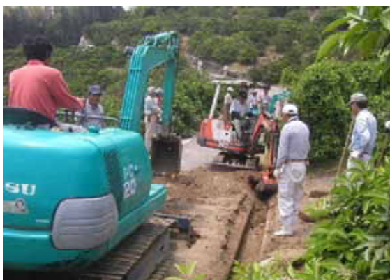
水路土砂上げ作業

来年度は当制度の今期対策の最終年度となるが、現在、農道の補修改良を進めているところである。