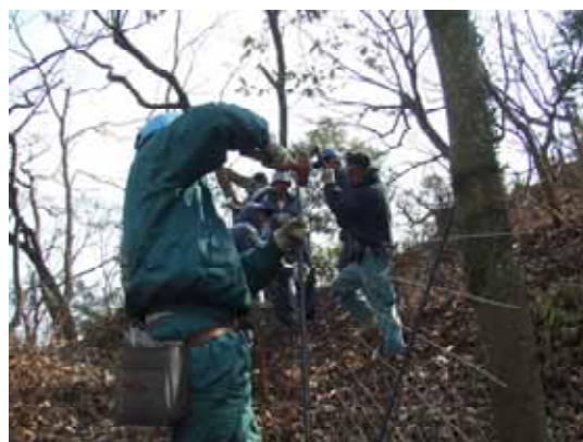
『イノシシ防護柵』設置作業