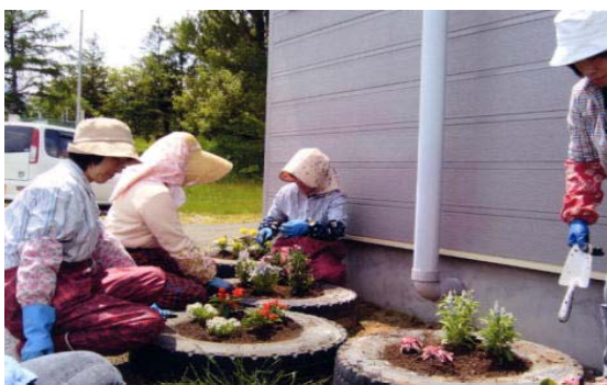
【集会施設周辺環境整備（花壇整備）】

さらに、グリーンツーリズム活動として従前より地区内で活動している「共和町ふれあい農園」では当制度を活用し、農業体験はもちろんのこと、収穫祭など様々な形による地元農業者との交流を通じ、地産地消の取り組みを進めている。