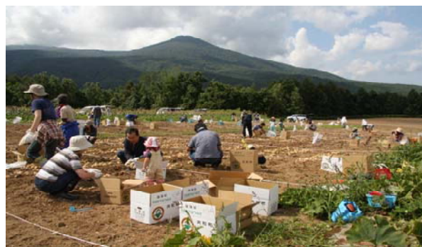
【市民・体験農園の開設運営（ふれあい農園）】