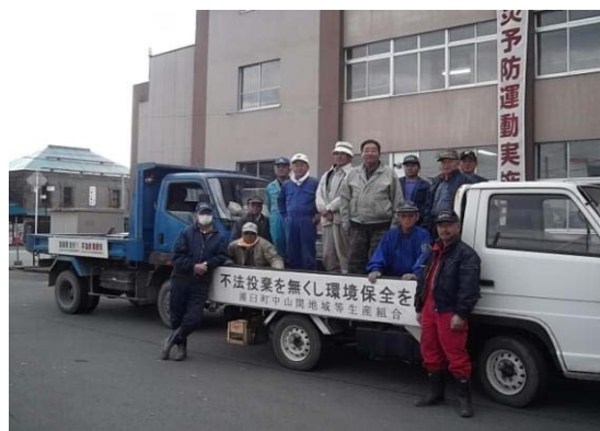
役場前にて活動報告