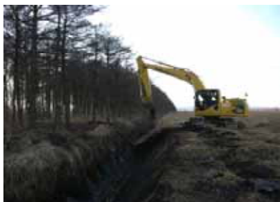
排水路の整備作業