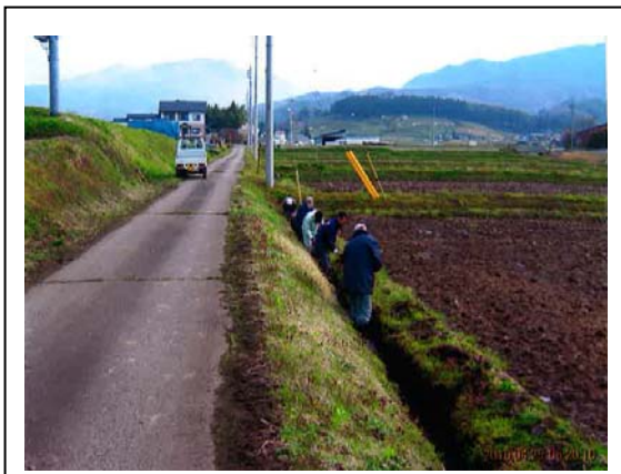
【水路泥上げ作業：春】

また、次世代の担い手を確保するため、新規就農者や認定農業者の育成に努め、良食味に配慮した米作りに集落一体となり取り組んでいる。