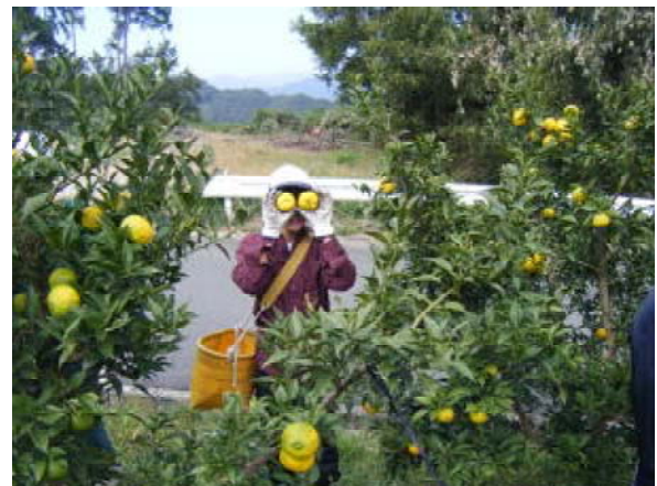
【農業体験（柿の収穫）】