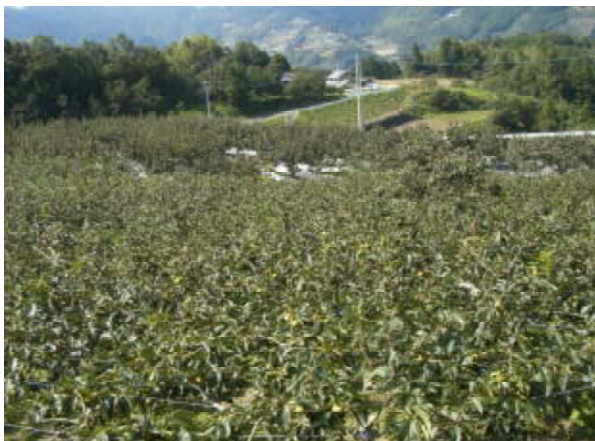
【集落に広がる柿園】

22名の協定参加者の内、17名が専業農家で果樹栽培を主体とした複合経営を行ってきた。主な取組みとして、集落内の施設（農道、暗渠排水）の老朽化に伴う補修等を計画的に実施していた。また、認定農業者の育成に積極的に取組み、現在7名の認定農業者が集落活動のリーダー的存在となっている。さらに、町内中学校と集落間で協定を締結し、中学2年生を対象に農業体験を実施している。これは集落の将来を担う子供たちに農業の大切さ、農村集落のすばらしさを体験を通じて関心を高めたいという思いから2期対策から実施しているもので今後も継続していく。