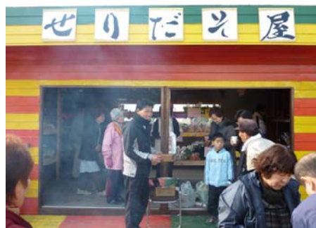
【直売所利用組合によるオープンイベント】