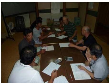
【機械利用組合と個人作業受託者との協議】

第2期対策までに稲作の作業受託の機械及び施設を整備し、下野西機械利用組合を設立。第3期対策ではさらなる施設の整備拡大とオペレーターの養成、個人作業受託者を取り込んだ協定の締結を進める。また、地域内で生産される農産物をはじめ加工品、工芸品等を販売するための直売所を本年度設置し、農産物等利用組合を立ち上げ運営を開始。施設は有人販売とし、直売所を訪れる集落住民をはじめ、国道325号線を通行中に立ち寄る観光客など、多くの人との交流による情報発信の拠点を目指している。今後、地域の特産となる農産物や加工品の開発、観光資源の掘り起こしを進めながら都市との交流につなげ、さらに耕作放棄地の発生防止や農地の有効利用、地域住民の所得の向上、元気な集落づくりを目指す。