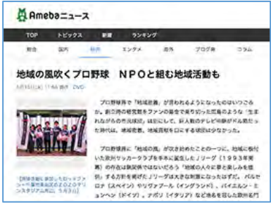
▼2018年5月15日(火) 【Amebaニュース】に第1回 千葉ロッテマリーンズ LEADS TO THE OCEANの記事が掲載されました。