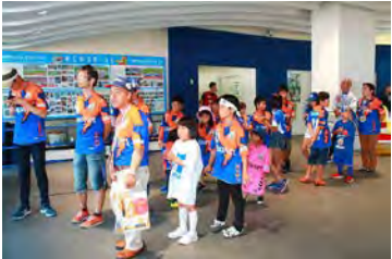
2018年5月12日(土) V・ファーレン長崎表彰式