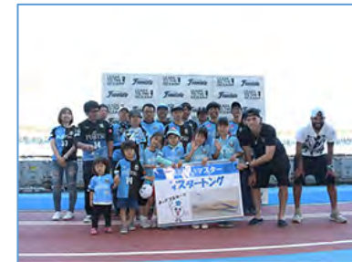
ゴミ拾いマスター人数推移 第3期 19人