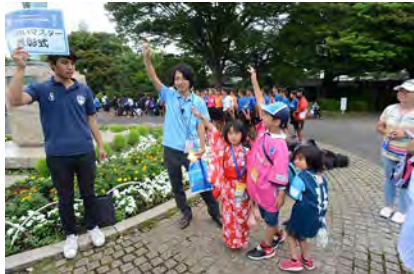
2018年7月7日(土) YOKOHAMA FC 表彰式