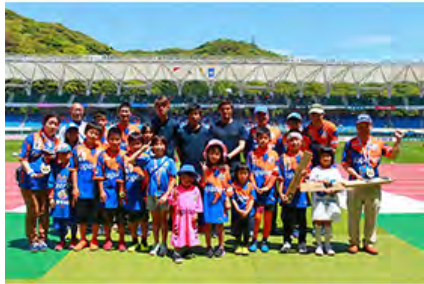
ゴミ拾いマスター人数推移 第2期 22人 第3期 21人