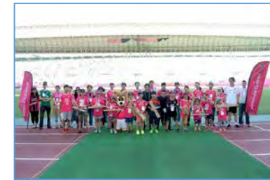
ゴミ拾いマスター人数推移 第2期 43人 第3期 38人

第1期 2015年7月～2016年6月末 第2期 2016年7月～2017年6月末 第3期 2017年7月～2018年6月末