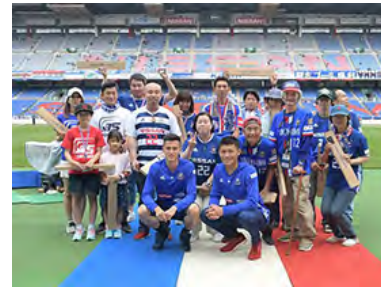
ゴミ拾いマスター人数推移 第3期 16人