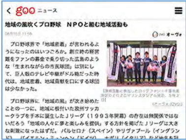
▼2018年5月15日(火) 【gooニュース】に第1回 千葉ロッテマリーンズ LEADS TO THE OCEANの記事が掲載されました。