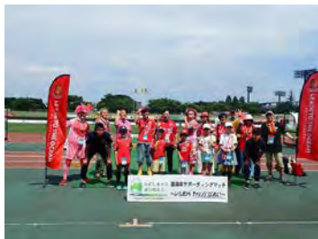
ゴミ拾いマスター人数推移 第2期 12人 第3期 17人