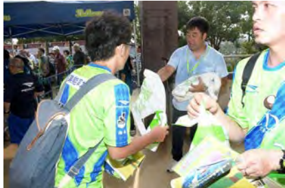
2018年7月18日(水) 湘南ベルマーレ表彰式