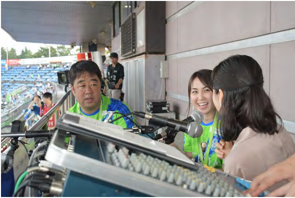
2018年7月18日(水) FM湘南ナパサ 78.3に生出演