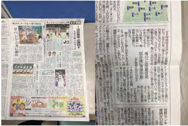
2018年7月4日 山梨日日新聞に掲載