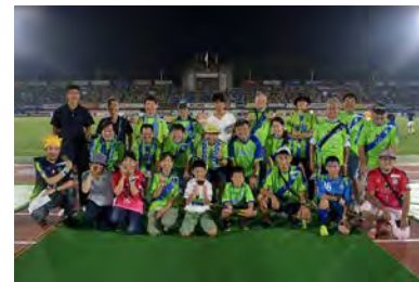
ゴミ拾いマスター人数推移 第1期 17人 第2期 12人 第3期 24人