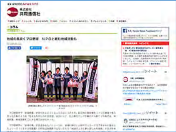
▼2018年5月15日(火) 【KYODO NEWS SITE】に第1回 千葉ロッテマリーンズ LEADS TO THE OCEANの記事が掲載されました。