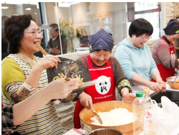
九州各地の郷土料理を巡る料理教室「おふくろの味 伝承塾」