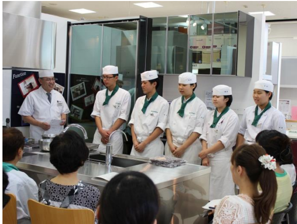
高校生レストラン（三重県立相可高校）を講師にしての料理教室

本部主導で行う活動と全国のショールームを活用した地域密着型の活動を複層的に行いながら日本型食生活の推進に取り組んでいます。