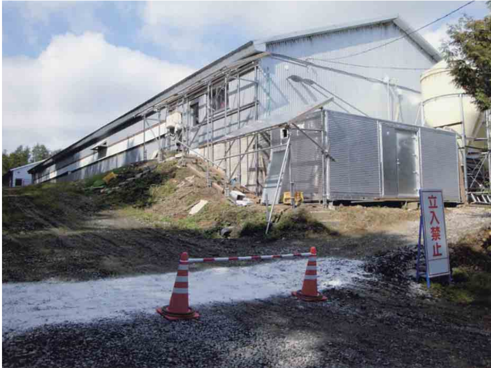
コーンと白線を用いた区分