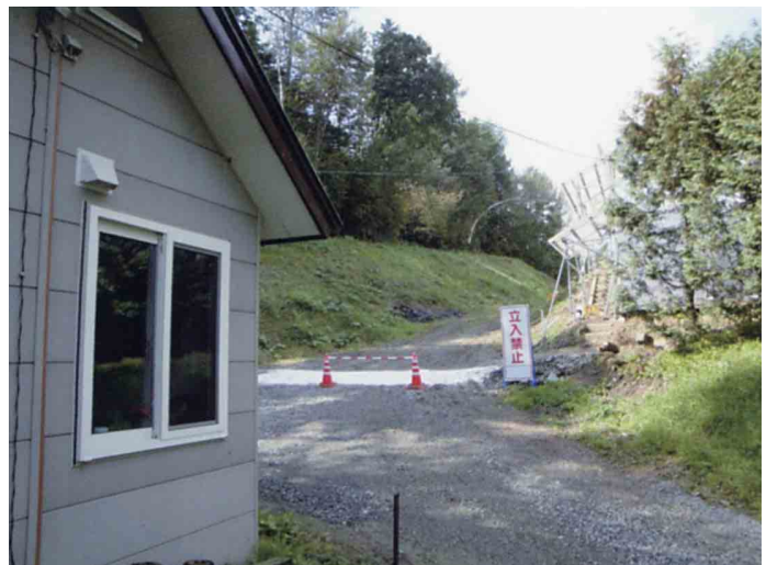
立入禁止の立看板とコーン及び白線による区分