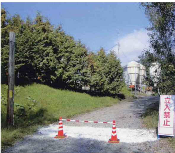
立入禁止の立看板とコーン及び白線による区分