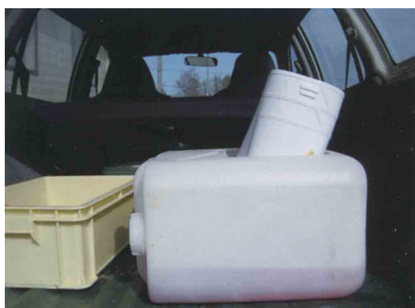
長靴用消毒容器の車載例