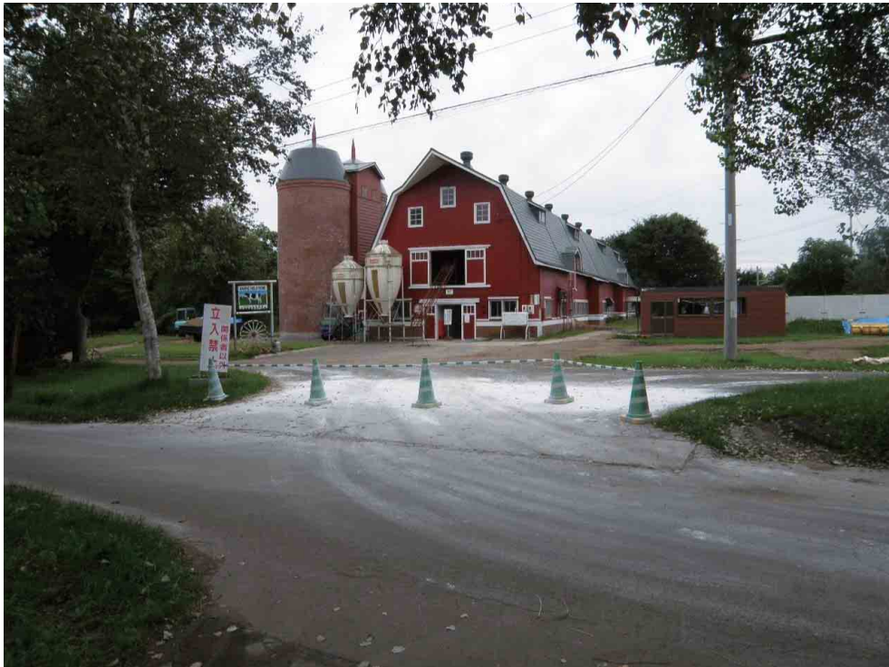
コーンを用いた区分