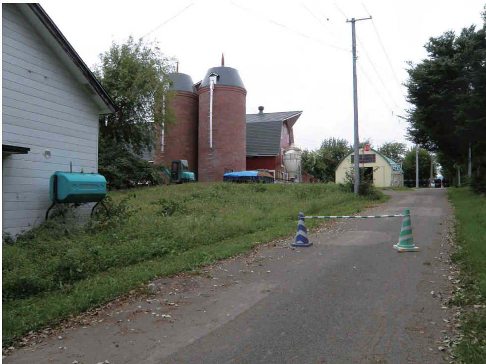
コーンを用いた区分