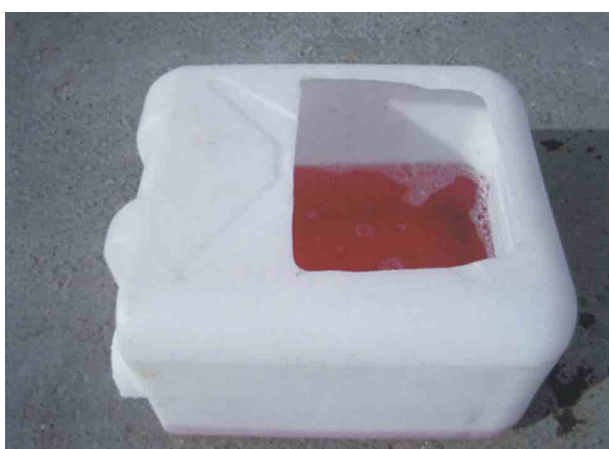
ポリタンクを改良した長靴用消毒容器